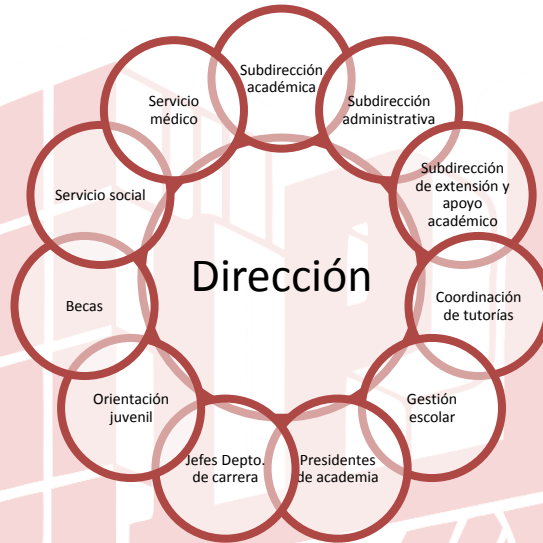
Fig. 1: Áreas participantes en el CEyS-PAT