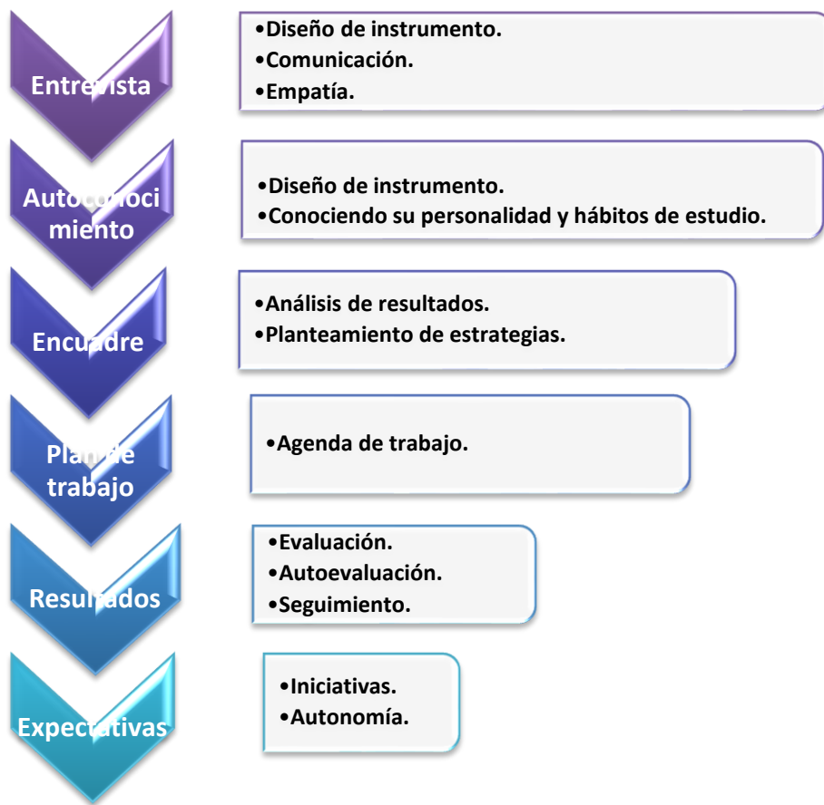
Diagrama 3. Mapa de proceso de la acción tutorial.

la siguiente cita se plantean estrategias de acompañamiento personal y canalización; así como un plan de trabajo para el tutorado. En el siguiente mapa se presenta la secuencia del proceso de acción tutorial durante un ciclo escolar (semestral).