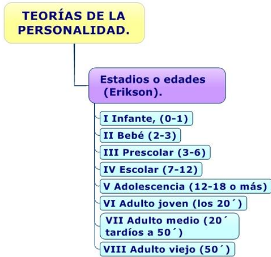
Figura 1. Etapas de la personalidad según Erikson.

En la figura 1 presentan las 8 fases (Dicaprio, 1985).