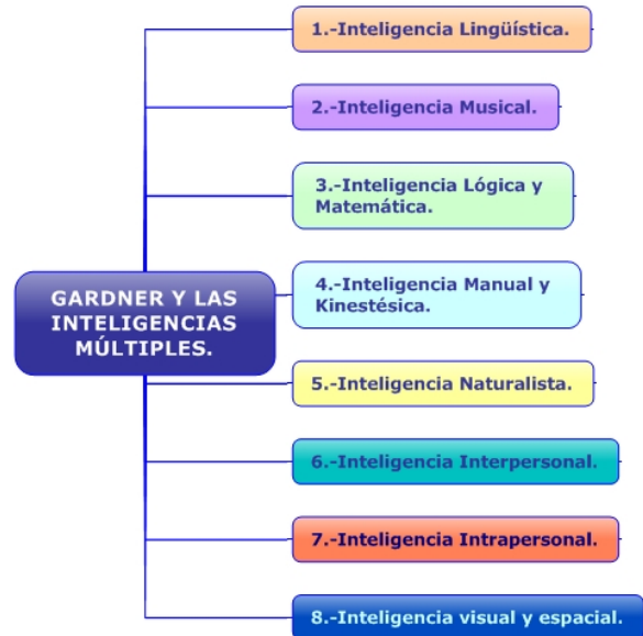
Figura 3. Inteligencias múltiples.